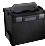
Aluca L-BOXX 374