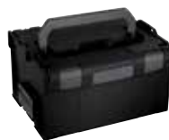
Aluca L-BOXX 238