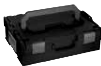
Aluca L-BOXX 136